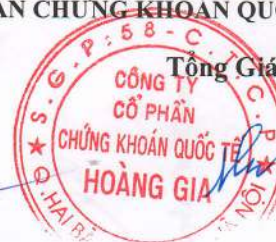
Trần Thị Thu Hương

(Các thuyết minh từ trang 12 đến trang 32 là bộ phận hợp thành của Báo cáo tài chính này)